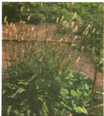
819. Гірчак зміїний.